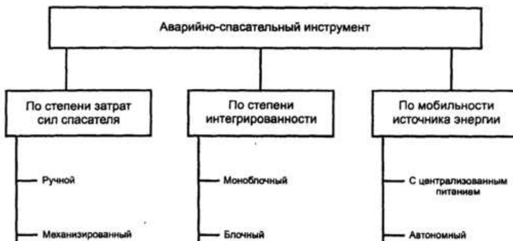
Рисунок А.3 - Схема классификации АПИ по признаку “Конструктивное исполнение инструмента”