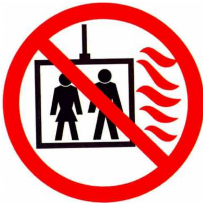
Рисунок 1 – Пиктограмма “Пользование лифтом во время пожара запрещено”

Примечание – При необходимости на пиктограмме может быть приведен следующий текст: “Пользование лифтом во время пожара запрещено”.