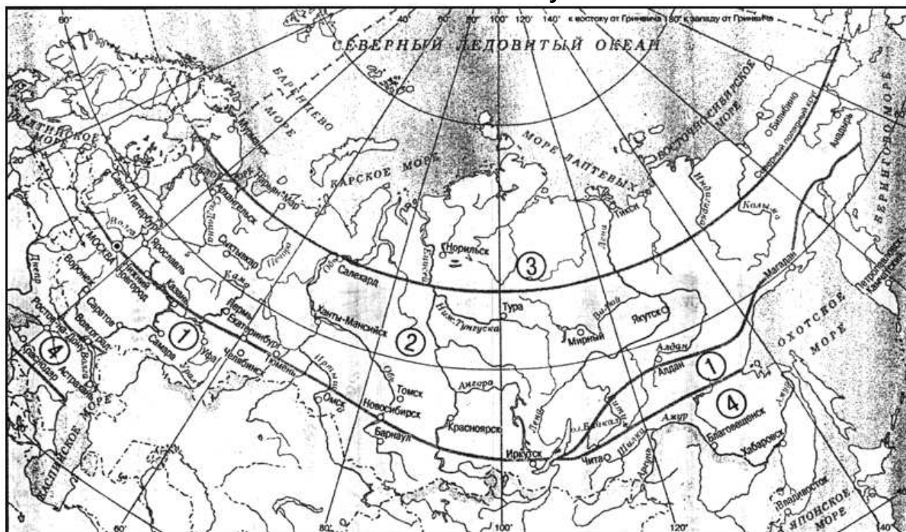
Рисунок В.1 - Классификация районов Российской Федерации в зависимости от климатических условий

Район 1 - северная граница: Великие Луки, Москва, Нижний Новгород, Казань, Екатеринбург, Тюмень, Новосибирск, южная часть Байкала, район Яблонового и Станового хребтов, побережье Охотского моря, Камчатка; южная граница: южная часть Урала, Саяны, Алтай, хребет Хамар-Дабан.