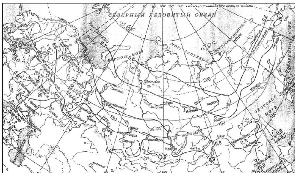
Рисунок 1 - Климатические коэффициенты для определения величины нагрузки на иловые площадки (сплошные и пунктирные линии) и продолжительности периода намораживания на иловых площадках, дни (точечные линии)

9.2.14.38 При использовании метода естественной сушки осадка следует предусматривать: конструкцию иловых площадок (на естественном или искусственном основании, с дренажом, каскадные, уплотнители и т.п.) - в зависимости от гидрогеологических и климатических условий, рельефа местности;